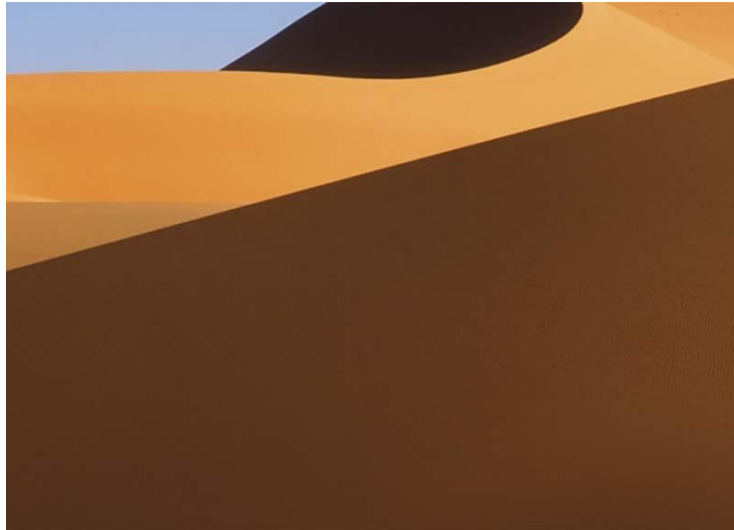
GUARDA LA FOTO SU YOUR DAILY PHOTOGRAPH